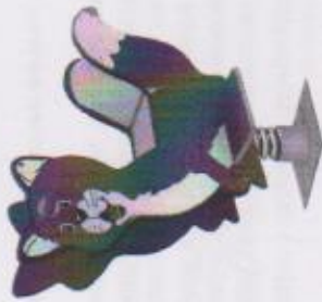
Рисунок 1 – общий вид и разбор качалки.

Заказчик с правилами эксплуатации и условиями гарантии ознакомлен. Претензий к комплектности и внешнему виду не имеет.